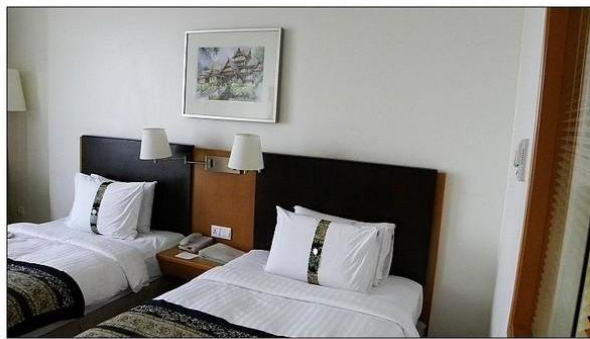
By : leo 舒服的大床~~~~~

闻名的沙撈越 (SATAY) 是将卤过的牛肉或鸡肉串成肉棒，然后在炭火上烧烤，佐以甜中带辣的花生酱汁，再配上黄瓜、洋葱和一种称为 KETUPAT 的马来饭团（裹上棕叶煮成的）一起食用。