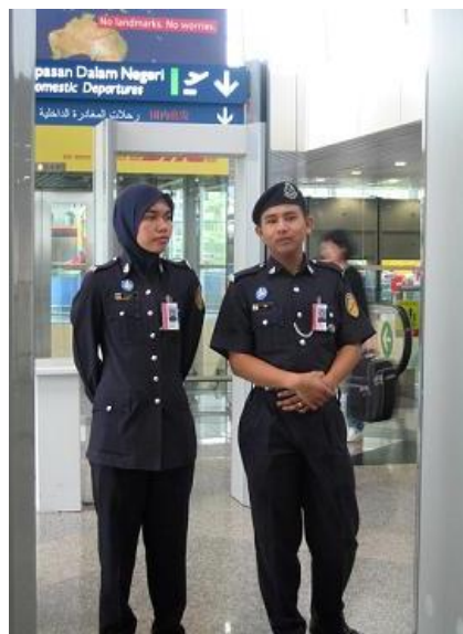
安检也很有特色