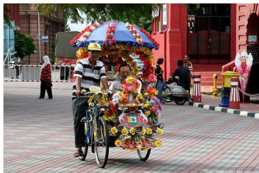
行驶在马六甲街头的花车