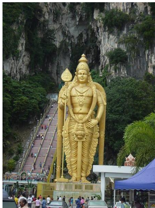
据说这是亚洲最大的室外铜佛像

黑风洞是马来西亚的印度教圣地，每年1月底2月初的大宝森节期间，虔诚的印度教徒背负神像，唱着宗教圣歌游行步入石洞参拜，朝圣者可达30万人。