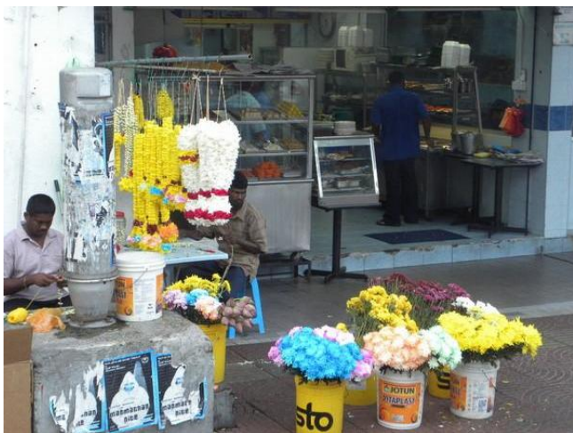
By : 长长的城

此外，马来西亚人对于体育运动非常爱好，那里主要盛行高尔夫球、足球、壁球、冲浪等运动，而马来西亚本地的传统休闲活动则有踢藤球（Sepak takraw）、玩大陀螺（Giant top spinning）和放风筝，游客不妨也去凑凑热闹。