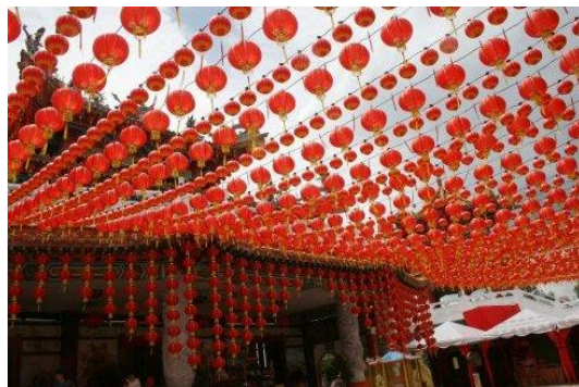
By : 长长的城