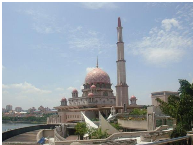
国家清真寺.旁边那个细细高高的是宣礼堂.