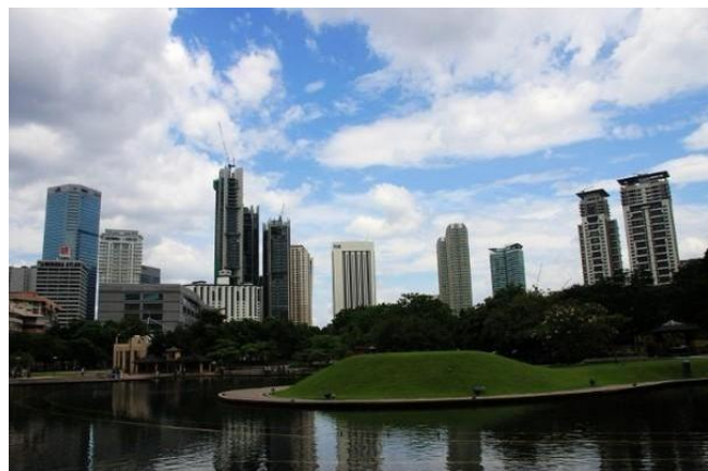
By: 艾米 双子塔前的公园。游人三三两两在此徘徊散步。

这里阳光充足、气候宜人，拥有很多高质量的海滩、奇特的海岛、原始热带丛林、珍贵的动植物、千姿百态的洞穴、古老的民俗民风、悠久的历史文化遗产和现代化的都市。当日暮西垂，夕阳的余辉隐没后，城里的夜游地点就开始夜生活的脉动了。卡拉OK歌廊、酒廊、戏院、舞厅、保龄球中心及台球中心等由你留连，还有那夜市，本地的沿街摆卖夜市集点缀其中，这夜生活是够多姿多彩了！